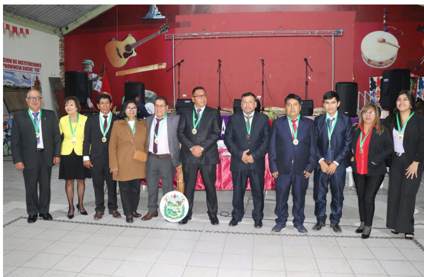
Directiva de Instituciones de la Provincia de la Mar - FIPLAMA