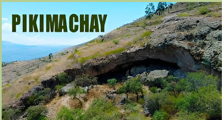
La "Cueva de Pikimachay"

La segunda ola migratoria de ayacuchanos, sobre todo de las provincias, se produjo en los años de la violencia, entre los años 80 y 90 del siglo pasado, quienes también ocuparon asentamientos humanos y barriadas en busca de un mejor porvenir. Actual-