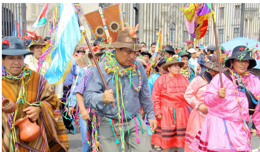
Festividad Tradicional, Valle del Sondondo.

La federación unida con sus 21 distritos y anexos, defiende los intereses y derechos de los pueblos de la provincia. Se estrechan los vínculos de amistad con instituciones similares del país y del extranjero. De igual manera con las actividades culturales carnavalescas y yunzas con nuestra música característica de Chuta chutay, y reinados a nivel de todos los pueblos de la provincia, y por ello se adquirió en aquellos tiempos un terreno propio en compra venta de 20 hectáreas aproximadamente en Villa El Salvador, que se perdió por negligencias propias y el actuar irregular del poder judicial. En esta época de globalización y neoliberalismo, es donde la federación preserva y cuida los bienes e intereses de la provincia, como el caso de las vicuñas en Pampa Galeras, que es la de mayor hábitat y reserva a nivel nacional; de igual manera en defensa del agua,