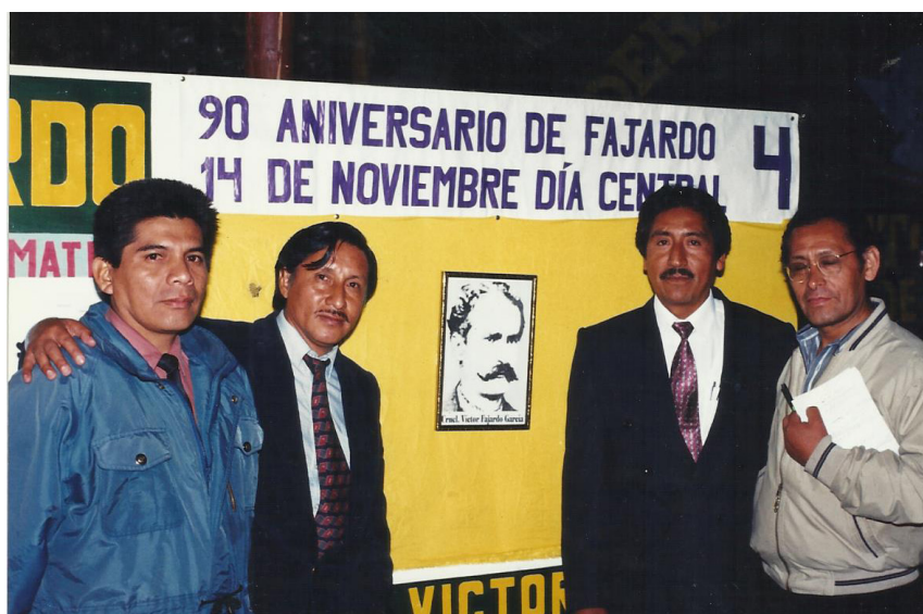
Directivos y líderes, Federación Fajardo.

En Navidad algunos pueblos como Umasi cultivan las Huaylias para adorar al Niño Dios.