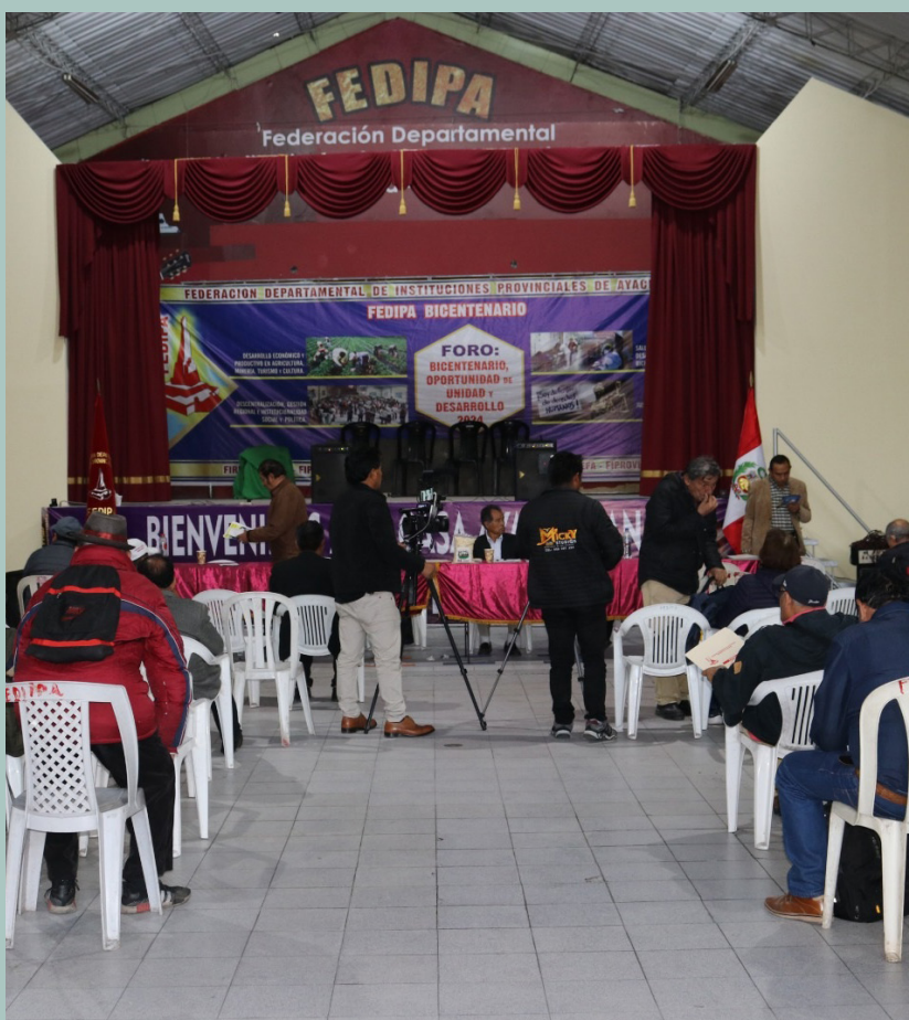
Certámenes local FEDIPA - Casa ayacuchana

“Para nosotros, contar con el local fue un gran logro, encontrábamos un espacio para reunirnos, coor-