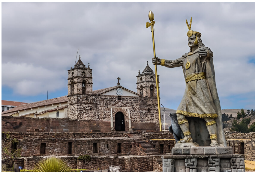
Gran Pachacutec, Santuario del sol y la luna y Templo Colonial - Vilcashuamán

Especial mención es la actividad del concurso de carnavales, Quena de Oro, que desarrolla la