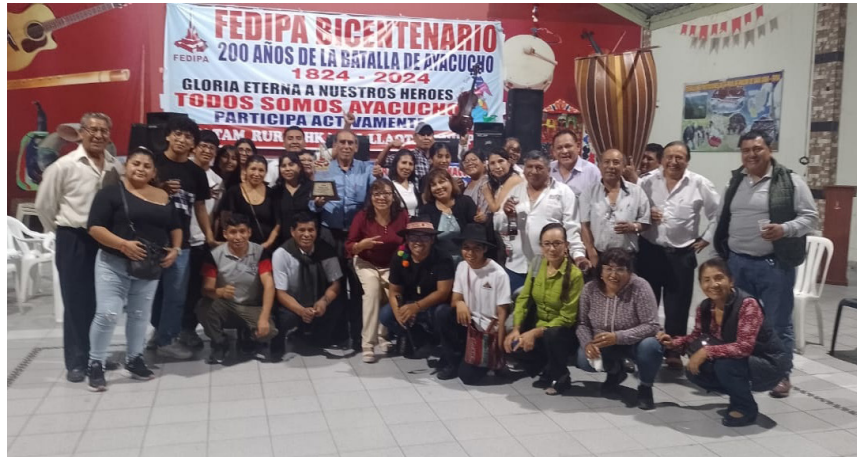
Parinacochas: trofeo “Vencedores de Ayacucho”.

Las fiestas patronales son las fechas tradicionales que los residentes Parinacochanos celebran