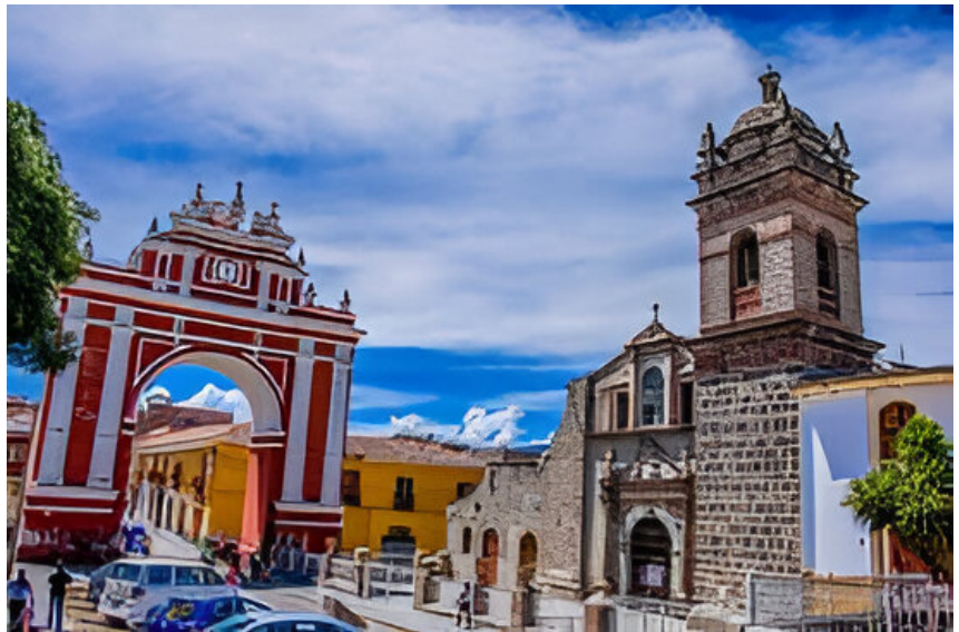
El “Arco del triunfo” y el templo de San Francisco de Asís.

En medio de toda esa circunstancia, se constituye la Federación Interdistrital de la Provincia de Huamanga, FIPHA, que integra a los 16 distritos de Huamanga. Todo esto constituye un gran impulso para todas las provincias de Ayacucho y, sobre todo, para FEDIPA, que instituye el carnaval “Vencedores de Ayacucho” en el año 90. Años más tarde, el Carnaval de Ayacucho sería declarado como Patrimonio Cultural de la Nación a solicitud expresa de FEDIPA.