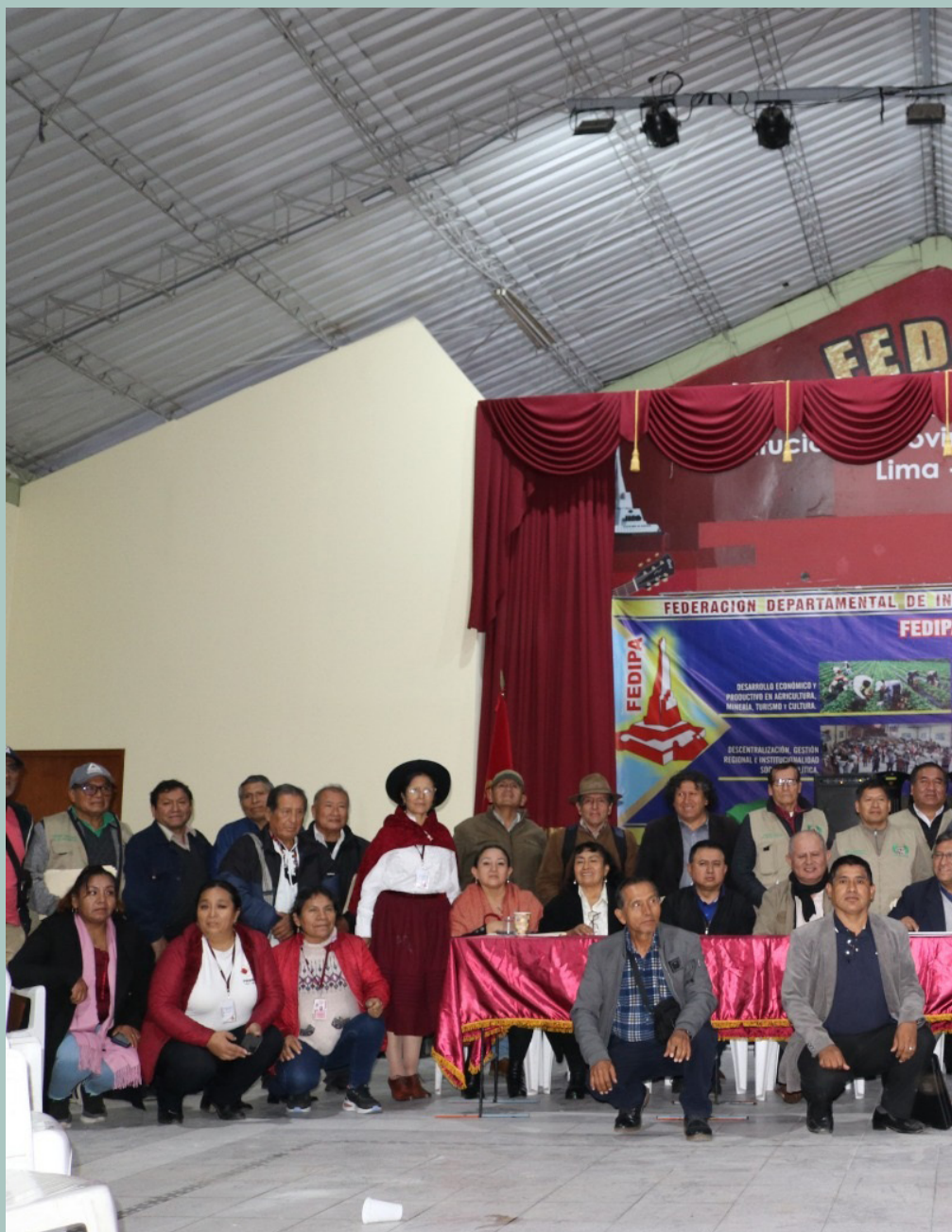
Foro Bicentenario 2024

Desde FEDIPA, se han promovido con regulari-