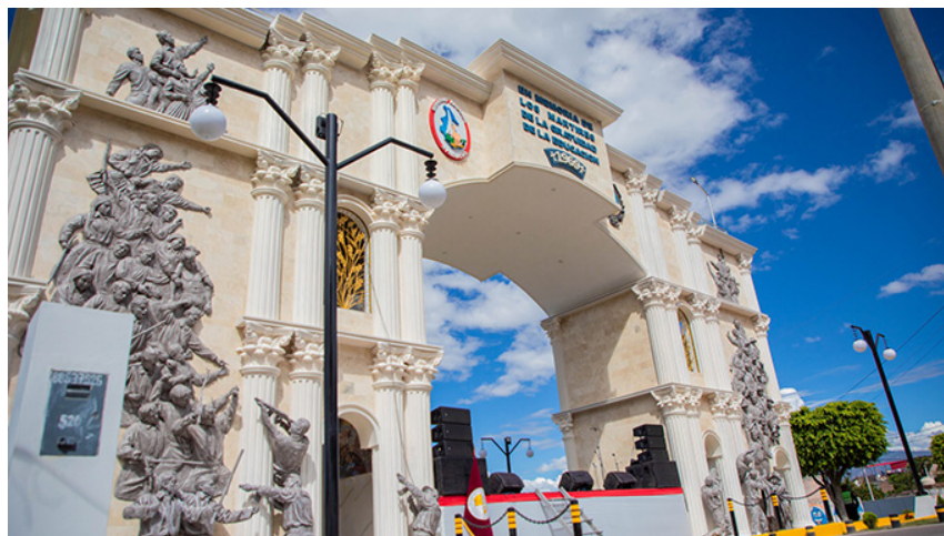
Arco de la Memoria - 22 de junio 1969