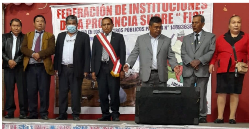
Directiva Federación de Instituciones de la provincia de Sucre (FIS)

A pesar de esos impasses la Federación de Sucre ha realizado diferentes gestiones y actividades