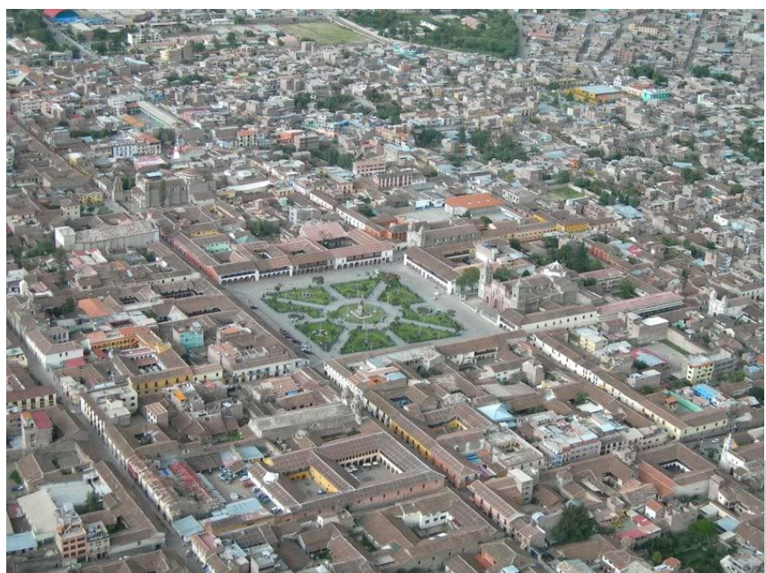
Centro Historico de Huamanga.