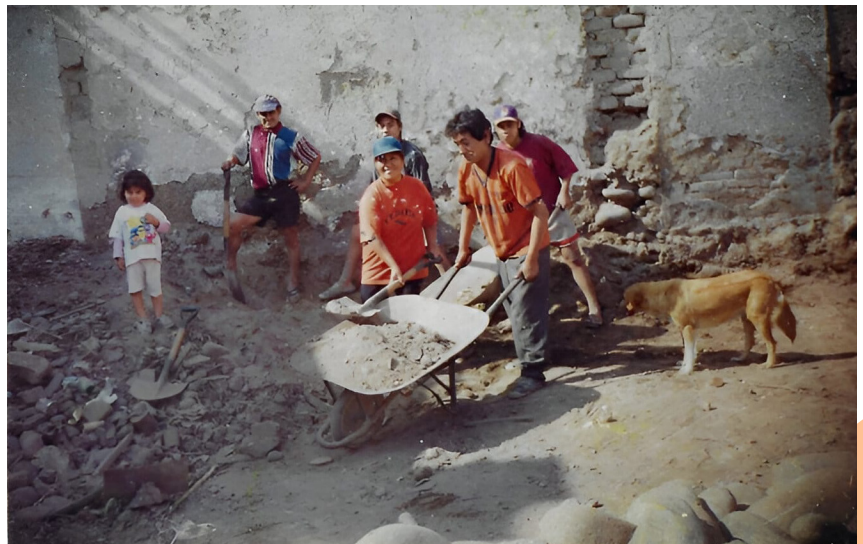
Cangallinos trabajando en la construcción del local de la FEDIPA, final años 90