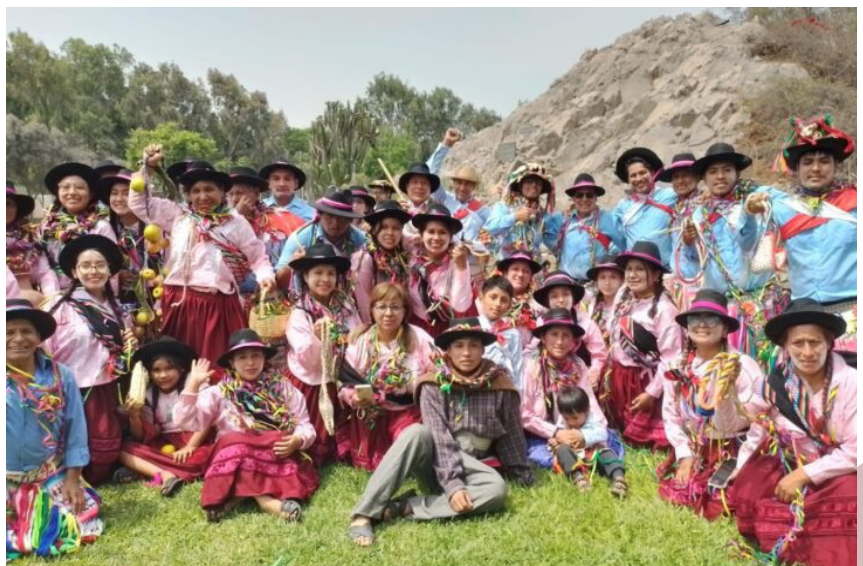
La Mar presente en carnavales.